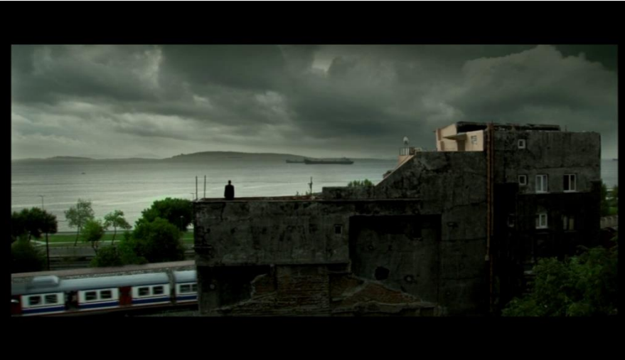
Bir karakter olarak mekan.