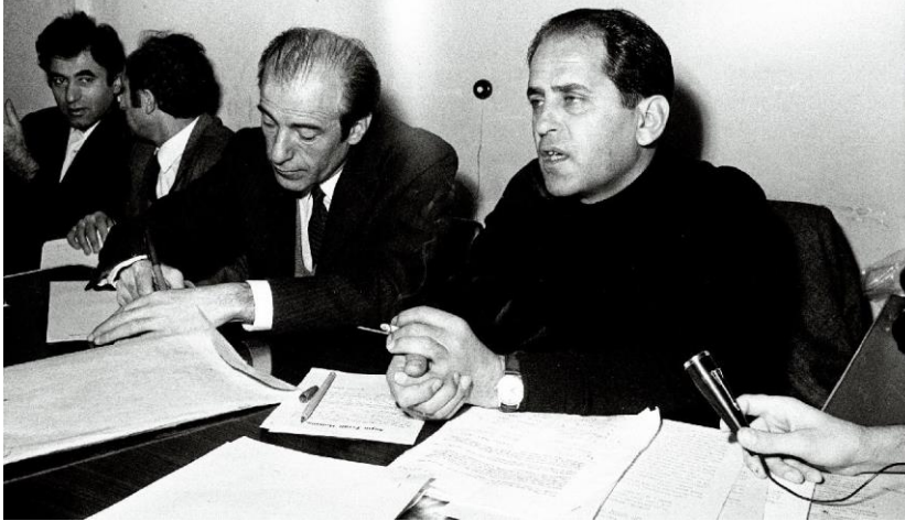
Türkiye Öğretmenler Sendikası (TÖS) Genel Başkanı Fakir Baykurt bir toplantıda.