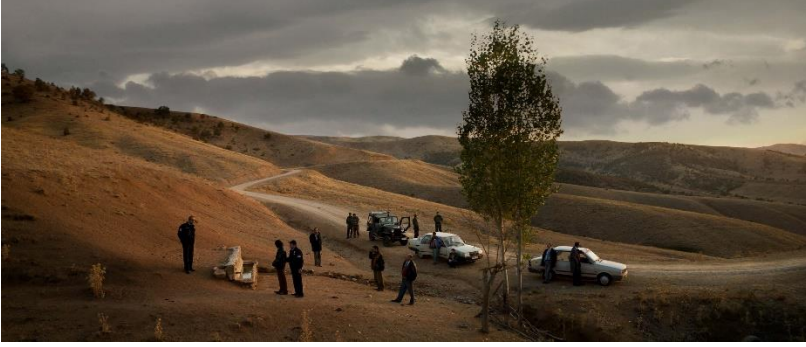
Soruşturma ekibi: Jandarma, polisler, kazıcılar, savcı, zanlılar.