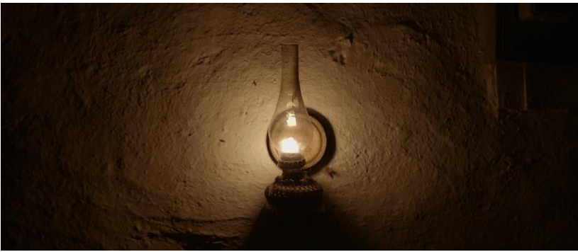
Elektrik kesilince ortalığı gaz lambası aydınlatır. Lamba, dişil bir simge olarak yer alır.