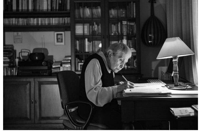
ARŞİV ODASI: Adalet Ağaoğlu, 1993 (Fotoğrafın üzerine sol tık yaparak bağlantıya ulaşabilirsiniz).