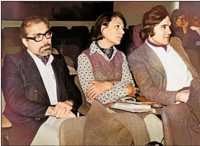
Emre Kongar, Adalet Ağaoğlu, İlber Ortaylı