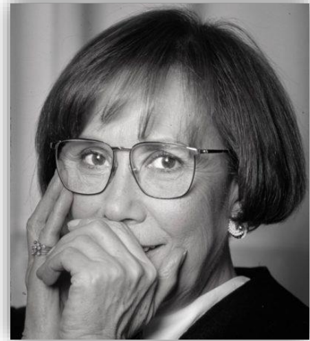
"Karanfilsiz" adlı öykünün seslendirilmiş haline fotoğrafın üzerine sol tık yaparak ulaşabilirsiniz.